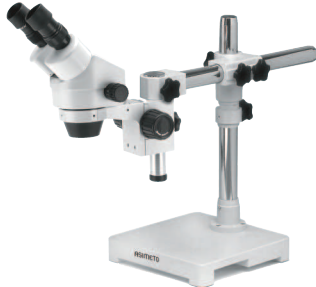
642-02-3 SZM 3