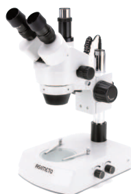
642-02-2 SZM 2